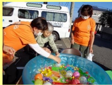
（ヨーヨー釣り・おもちゃすくい）