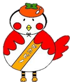
かたぎはらマスコットキャラクター かたピー

※事前予約制です 来所またはお電話にて参加人数をお知らせ下さい 小規模多機能かたぎはら 075-393-2200 まで